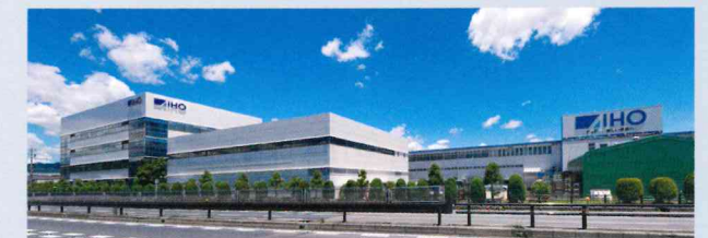
[本社・工場] 愛知県豊川市

機器の開発・製造のすべてを国内生産。日本の厨房設備環境に合わせて開発されたので、より使いやすく設計されています。また導入後も、24時間365日対応可能なメンテナンス体制で安心サポート致します。